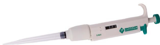
Рисунок 8 – Дозатор пипеточный одноканальный серии ЭКОХИМ фиксированного объёма, автоклавируемый