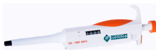
Рисунок 7 – Дозатор пипеточный одноканальный серии ЭКОХИМ переменного объёма