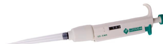
Рисунок 9 – Дозатор пипеточный одноканальный серии ЭКОХИМ переменного объёма, автоклавируемый

Пломбирование дозаторов не предусмотрено.