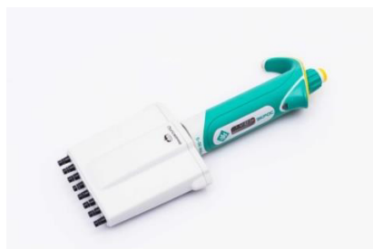
Рисунок 4 – Дозатор пипеточный многоканальный серии ЭКРОС переменного объёма, автоклавируемый