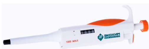
Рисунок 6 – Дозатор пипеточный одноканальный серии ЭКОХИМ фиксированного объёма