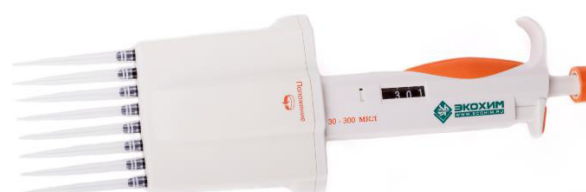
Рисунок 5 – Дозатор пипеточный многоканальный серии ЭКОХИМ переменного объёма