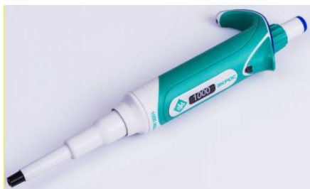
Рисунок 2 – Дозатор пипеточный одноканальный серии ЭКРОС фиксированного объёма, автоклавируемый