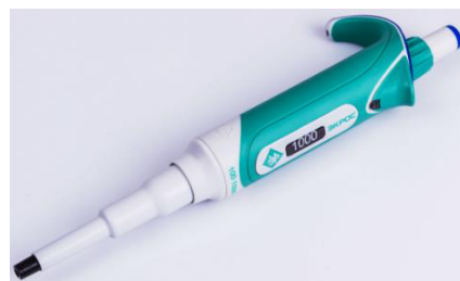
Рисунок 3 – Дозатор пипеточный одноканальный серии ЭКРОС переменного объёма, автоклавируемый