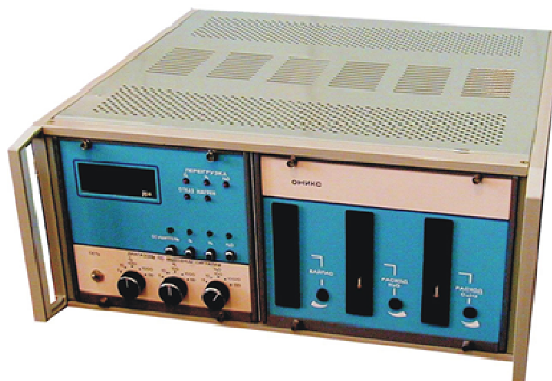
Рисунок 1 – Внешний вид газоанализатора